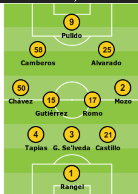
Guadalajara - Club América (6/03/2025 1-0)