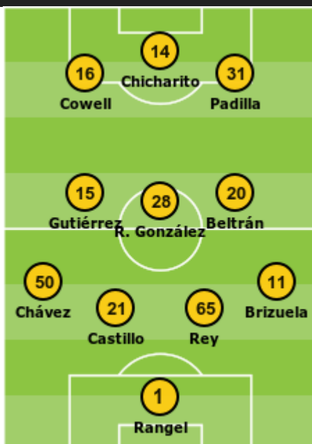
Guadalajara - Cibao (13/02/2025 3-0)