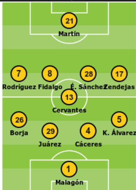
Guadalajara - Club América (6/03/2025 1-0)