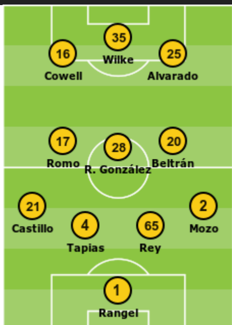
Cibao - Guadalajara (7/02/2025 1-1)