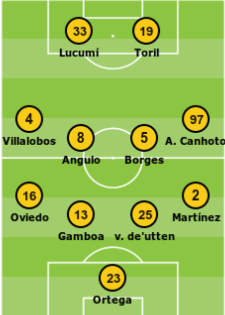
Pumas UNAM - Alajuelense (5/03/2025 2-0)