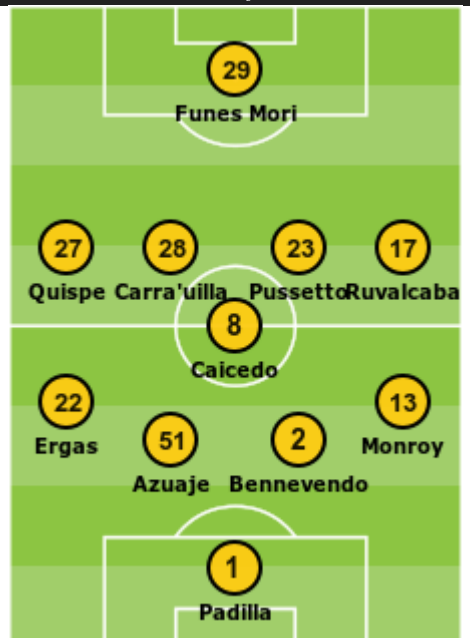
Pumas UNAM - Alajuelense (5/03/2025 2-0)

Suplentes: 58. Martínez Por Ruvalcaba, 82. Ávila Por Pussetto, 83. Rivas Por Funes Mori, 88. Rico Por Quispe