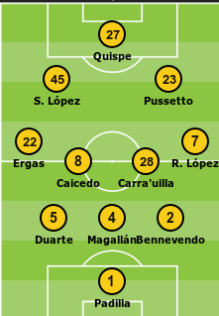
Pumas UNAM - Cavalry (14/02/2025 2-0)