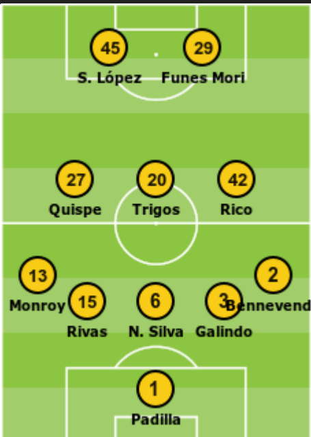
Cavalry - Pumas UNAM (7/02/2025 2-1)